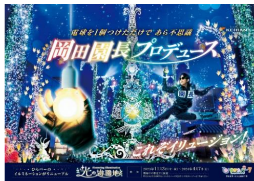
「2023年度 冬ポスター」ビジュアル

また、「2023年度 冬ポスター」ビジュアルを2023年12月4日(月)から京阪電車沿線等で順次公開いたします。