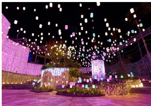
光のランタン広場