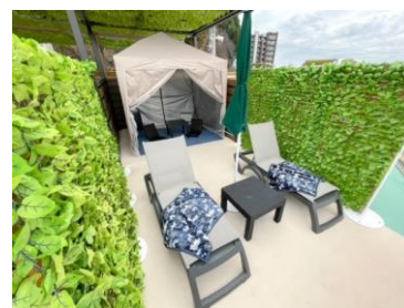
※画像は昨年の様子です