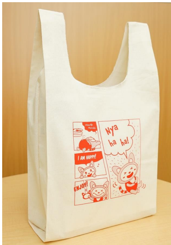
そうにゃんお楽しみ袋 2022（イメージ）