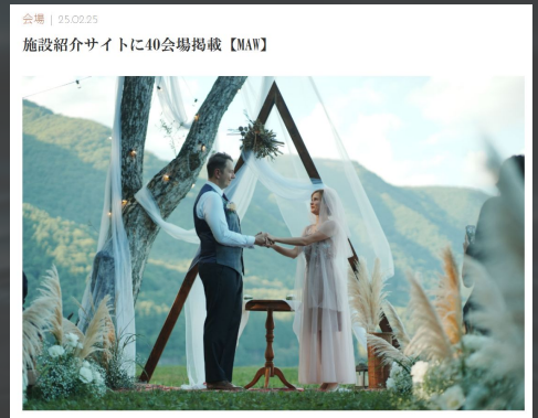
ブライダル産業新聞様