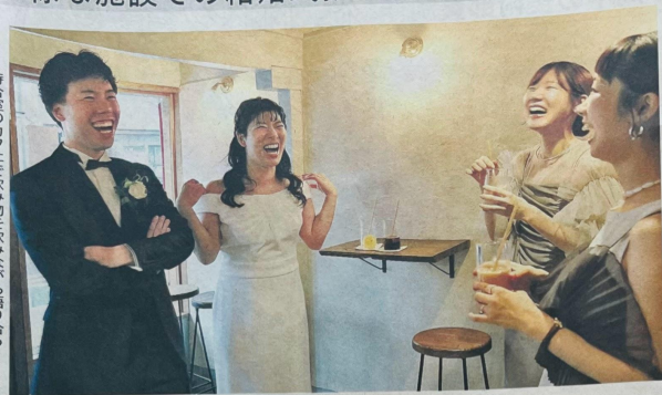
待合室のカフェで飲み物を飲みながら語り合う （左から新郎新婦、招待客）