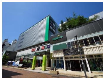
[コピス吉祥寺外観]