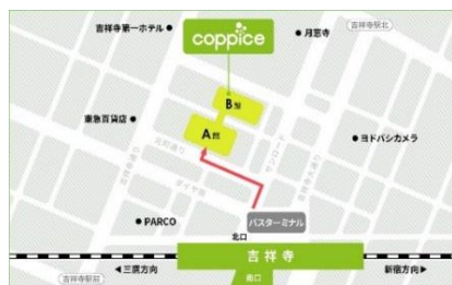
[コピス吉祥寺アクセス MAP]