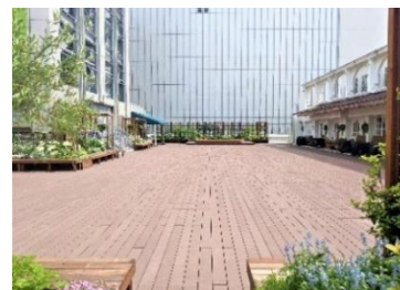
[A 館 3 階屋外スペース「GREENING 広場」]