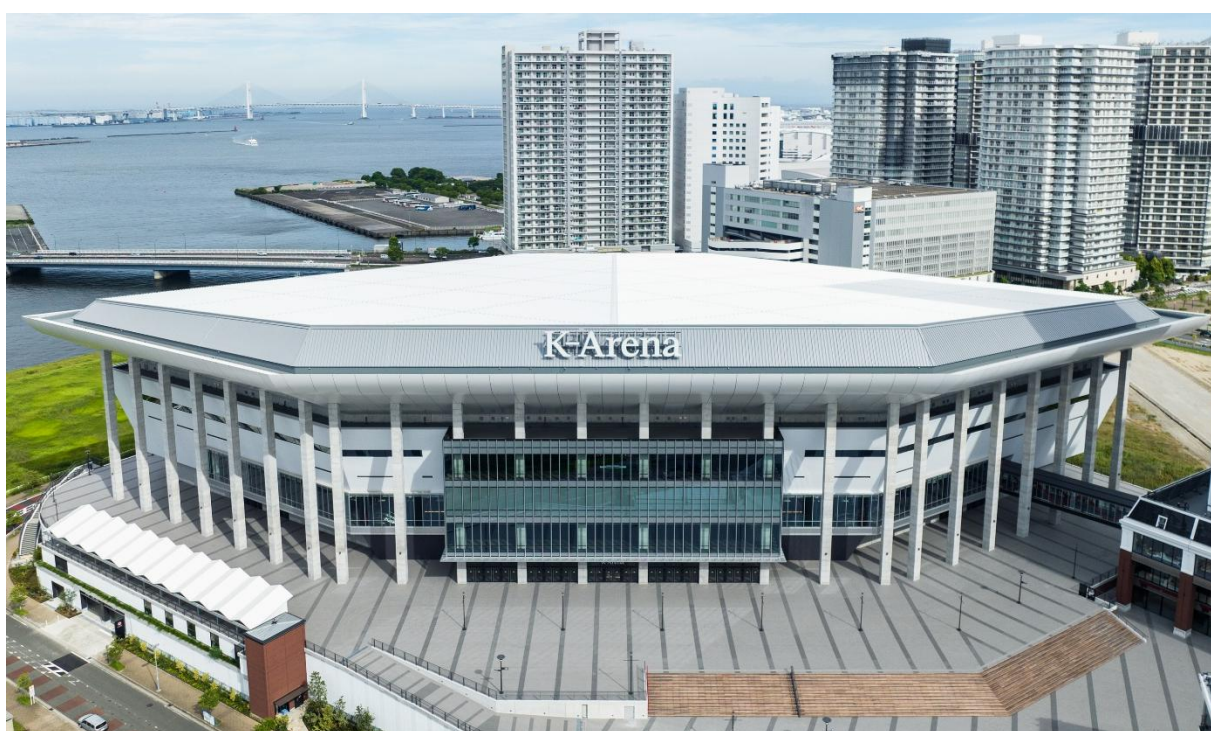
アリーナ外観(正面)

Pollstar（ポールスター）は、米国および国際的なコンサート・ライブミュージック業界の業界紙で、コンサートプロモーター、ブッキングエージェント、アーティスト関係者、施設経営者、その他ライブエンタテインメントビジネスに関わる業界団体向けに月刊誌の発行（定期購読者数1万人超）および、ウェブサイトでの情報提供（SNSの総フォロワー数約8万人）をしている媒体となります。