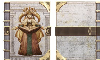
④ ブックカバー 「カルドラ(日本限定)」