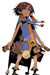
② 松浦聖氏描き起こし 「ナジャラン」