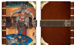
③ ブックカバー 「カルドラ(1st)」