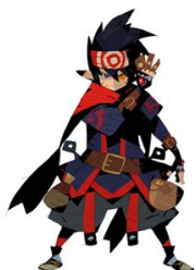
① 松浦聖氏描き起こし 「ゼナス」