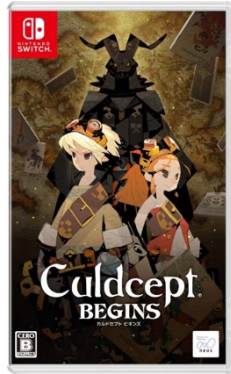
Nintendo Switch 表面