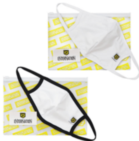
ENTERNATIONオリジナル ポーチ付きマウスカバーセット ¥2,000(内税)