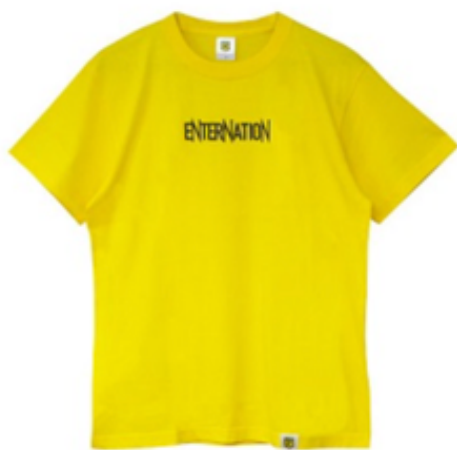
ENTERNATIONオリジナル カナリアTシャツ ¥3,000(内税)

ENTERNATIONオフィシャルグッズサイト : https://enternation.shop-pro.jp