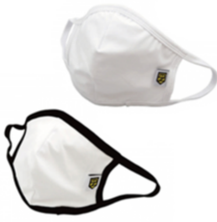
ENTERNATIONオリジナル マウスカバー ¥1,000(内税)