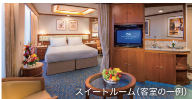
スイートルーム(客室の一例)