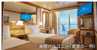
海側バルコニー(客室の一例)