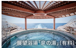
展望浴場「泉の湯」(有料)

※詳しい旅行条件を説明した書面をお渡しいたしますので、事前にご確認の上、お申し込みください。