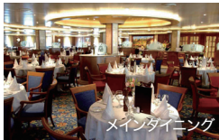
メインダイニング