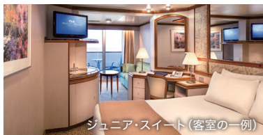
ジュニア・スイート(客室の一例)