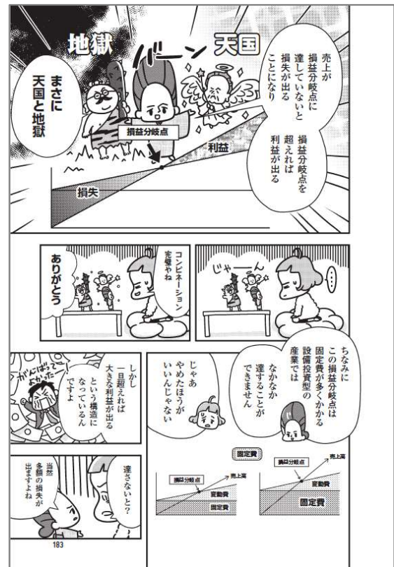
利益を得やすくするには? 「損益分岐点」と「限界利益」