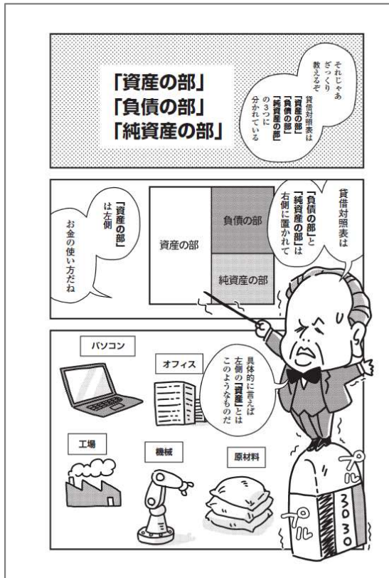
会社の財務状況を把握する 「貸借対照表」