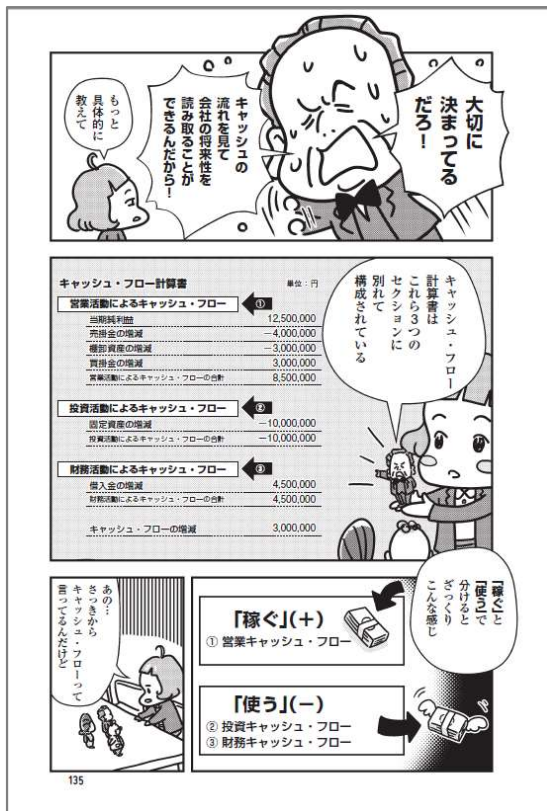
会社の資金の動きがわかる 「キャッシュ・フロー計算書」